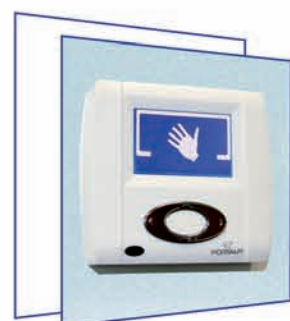
Консоль управления NAVIBLU