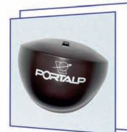
JANUS / COLIBRI датчики движения (радары)