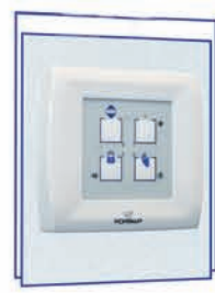
Консоль управления 4T