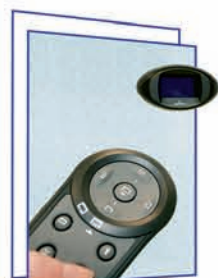
Пульт дистанционного управления S